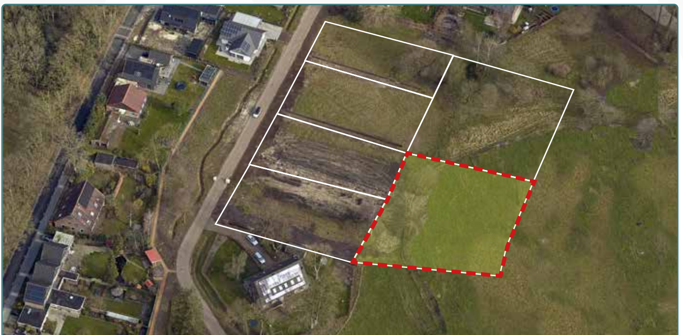
Kavel 152 vanuit de lucht