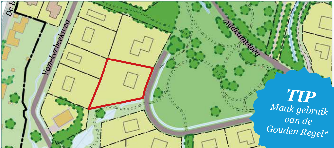
Situatietekening kavel 152